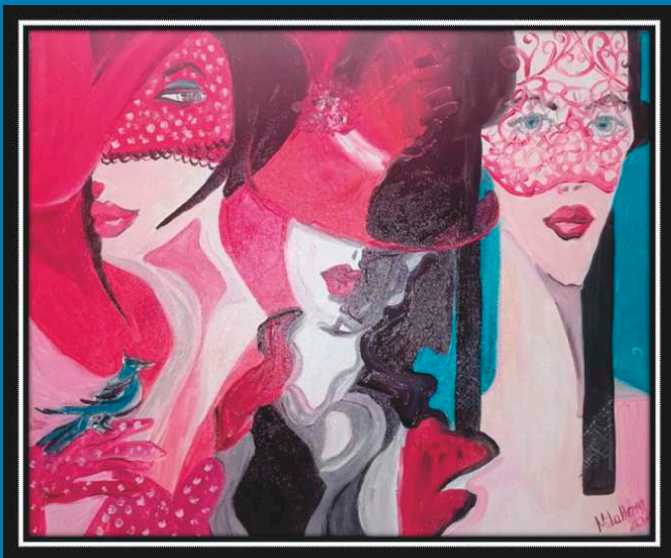
Уметничка слика са изложбе Данијеле Миланове на Фестивалу драмских аматера села Србије - ФЕДРАС 2020. – Мало Црниће „Стендалове жене“ (уље на платну, 50x50)